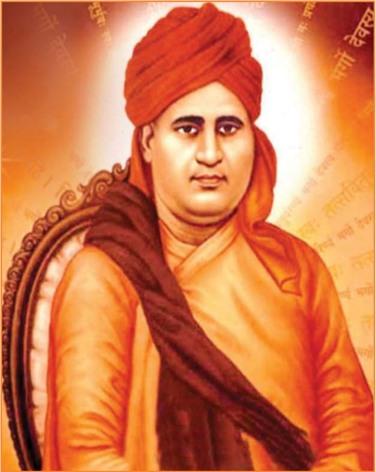
Maharishi Swami Dayananda Saraswati