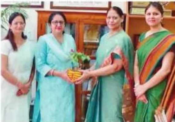
मेहमानों का स्वागत करता कॉलेज स्टाफ।

चंडीगढ़, 1 जून (वैभव): मेहरचंद महाजन डी.ए.वी. कॉलेज फॉर वूमैन सेक्टर-36 की स्कूल डेवलपमेंट कमेटी ने शिक्षकों एवं रिसर्च स्कॉलर्स के लिए स्कूल डेवलपमेंट के तहत कैरिकुलम डेवलपमेंट पर शनिवार को कार्यशाला लगाई गई। शैक्षिक प्रणाली में सकारात्मक सुधार लाने के लिए एक योजनाबद्ध, उद्देश्यपूर्ण, प्रगतिशील और व्यवस्थित प्रक्रिया जैसे विभिन्न घटकों पर आधारित इस कार्यशाला का उद्देश्य पाठ्यक्रम विकास में शामिल प्रक्रियाओं, योजनाओं, डिजाइनिंग सामग्री, कार्यान्वयन, मूल्यांकन से प्रतिभागियों को अवगत