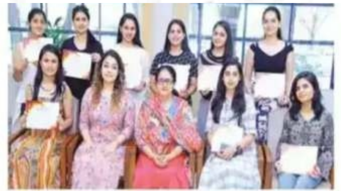
फ्रेंच भाषा पर आयोजित कार्यशाला में हिस्सा लेने वाली छात्राएं और अध्यापक।