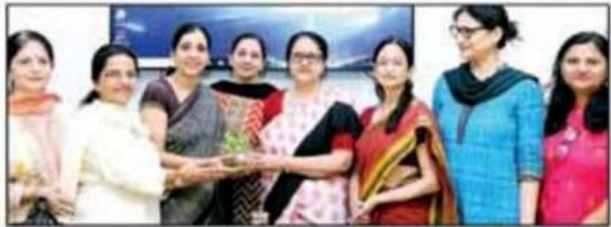
Faculty members and 32 aspiring students participate in the inauguration ceremony.

In continuation of its endeavours to promote skills in varied fields, the Skill Development Committee of Mehr Chand Mahajan DAV College for Women began a 7-day bridge course for beginners in