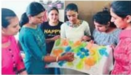
कार्यशाला के दौरान रचनात्मक कार्य करती हुई छात्राएं। (संलग्न) फोल्डर, पाउच, पोर्टलिस, आदि को सहाज को (इस प्रकारों के माध्यम से एम.सी.एम. कलास रूप टीचिंग बड़ी खूबसूरती से प्रदर्शित किया गया।

चंडीगढ़, 7 जून (वैभव): मेहर चंद महाजन डी.ए.वी. कॉलेज फॉर वुमेन सेक्टर-36 में फैब्रिक ऑनमेंटेशन पर आयोजित 10 दिवसीय कौशल विकास कार्यशाला हस्तकला का शुक्रवार को सफलतापूर्वक समापन हुआ। कॉलेज के इंटरनल इन्सॉल्टी एग्जॉसिब सेल के तत्वाधान में होम साइंस विभाग द्वारा आयोजित कार्यशाला में टाई और डाई, खादी ब्लॉक प्रिंटिंग, फैब्रिक पेंटिंग, कढ़ाई और ऑनमेंटेशन को कला पर विभिन्न सत्र आयोजित किए गए। प्रतिभागियों ने कार्यशाला के दौरान उनके द्वारा किए गए रचनात्मक कार्यों