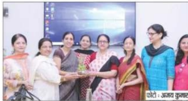
विषय में इच्छुक छात्राओं के साथ साथ कॉलेज के फैकल्टी मेंबर्स भी उपस्थित और मैक्रो और

चंडीगढ़, 24 जून। विभिन्न क्षेत्रों में कौशल को बढ़ावा देने के अपने प्रयासों को आगे बढ़ते हुए, सेक्टर-36 स्थित डीएवी कॉलेज फॉर वुमेन की कौशल विकास समिति ने आज यहां सात दिवसीय अर्थशास्त्र में ब्रिज कोर्स शुरू किया। अपने आगामी पाठ्यक्रम में अर्थशास्त्र विषय को चुनने के इच्छुक छात्राओं ने इस विषय पर प्रारंभिक जानाजान हेतु इस कोर्स में बहचड़ कर