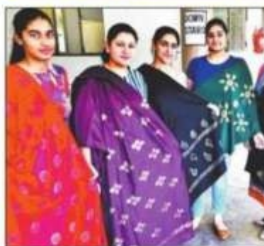
कार्यशाला में तैयार किए गए दुपट्टों को दिखाती

एमसीएम में 10 दिवसीय कौशल विकास कार्यशाला की ओर से बनाए गए विभिन्न रचनात्मक कार्यों