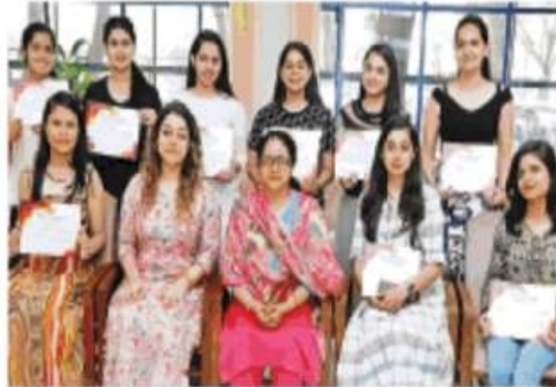
चंडीगढ़: एमसीएम डीएवी कॉलेज-36 में फ्रेंच भाषा वर्कशॉप में भाग लेने वाले प्रतिभागी