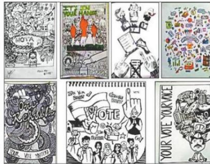
छात्रों की ओर से डूडल आर्ट प्रतियोगिता में दी गई प्रतिक्रिया।

चंडीगढ़। सेक्टर-36 स्थित एमसीएम डीएवी कॉलेज फॉर गर्ल्स में सोमवार को मोनो एक्टिंग और डूडल आर्ट प्रतियोगिता करवाई गई। ऑनलाइन प्रतियोगिता कॉलेज की स्वच्छता समिति और कल्चरल कमेटी ने आयोजित करवाई। प्रतियोगिता 'वर्तमान महामारी में स्वच्छता की सख्त आवश्यकता' विषय पर आधारित थी। इसमें कोरोना वायरस से लड़ने में स्वच्छ परिवेश के महत्व से इस जागरूकता बढ़ाने के उद्देश्य से इस प्रतियोगिता में तीन श्रेणियों के तहत वीडियो प्रस्तुत किए गए, जिसमें मोनो एक्टिंग, सीन एक्टमेंट और थीम बेस्ड रैप संगीत शामिल था। प्रतिभागियों ने सरल विचारों के साथ विषय को अपने सीन में प्रदर्शित किया।