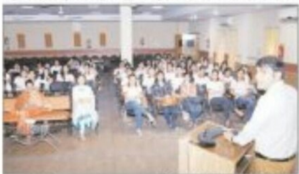
अर्थ प्रकाश संवाददाता

संबंधिकः। एमसीरम डीएवी करिलेव में चल रहे सता दिवसीय एनएसएस कैंप के पांचवे दिन चंडीमह पुलिस करियों द्वारा सेल्फ डिफेन्स ट्रेनिंग सव का आयोजन किया नथा। इस अवसर पर पुलिस करियों ने एनएसएस स्वयं सेवकों को स्टॉकिंग, ईवर्रीनंग एवं महिलाओं के प्रति