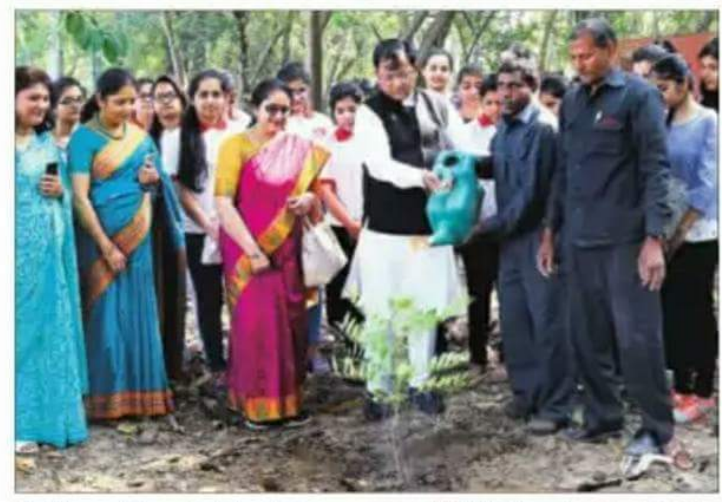
UT Mayor Davesh Moudgil opens an artificial forest at the MCM DAV College for Women in Chandigarh.

Moudgil planted the first sapling in the forest that will have over 30 species of various medicinal and ornamental plants such as giloy, camphor, murraya, amla, insulin plant, ashwagandha, reetha and wild roses.—TNS