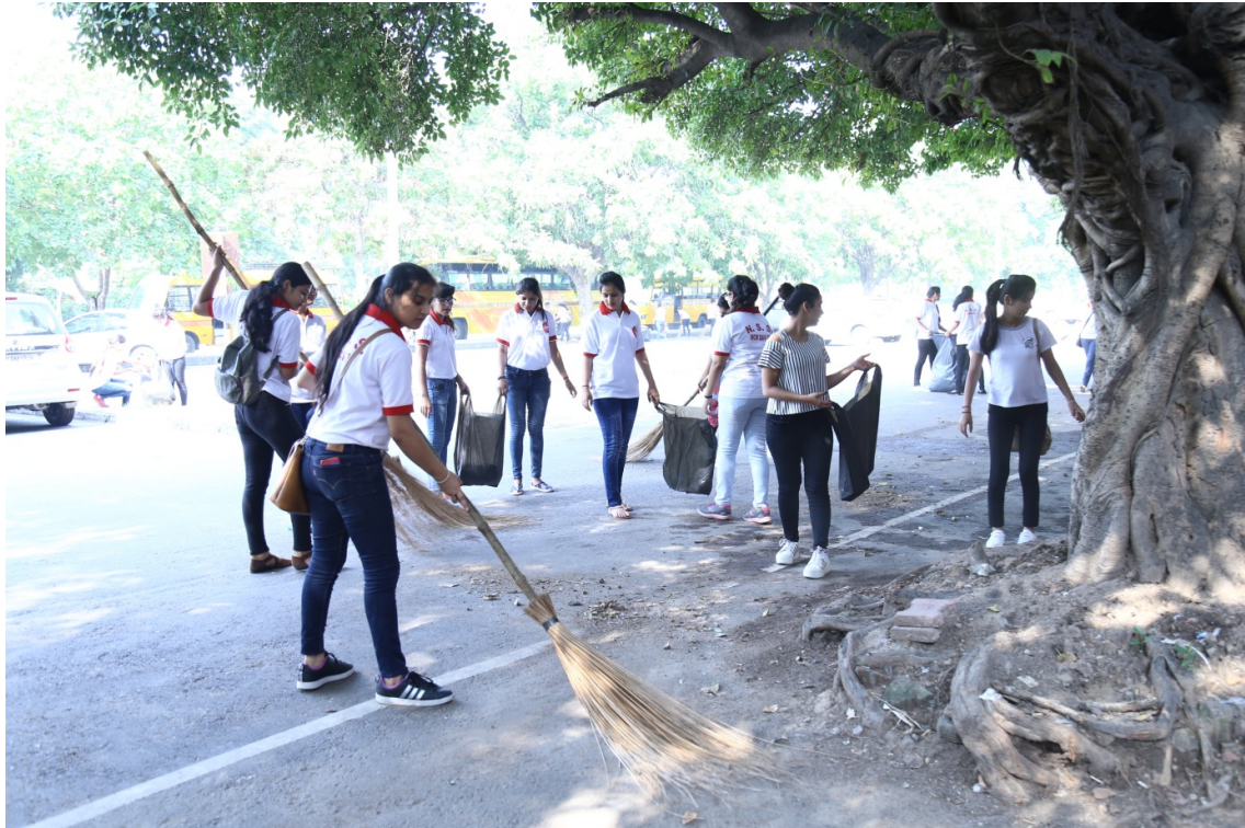
Day-3: October 1, 2017