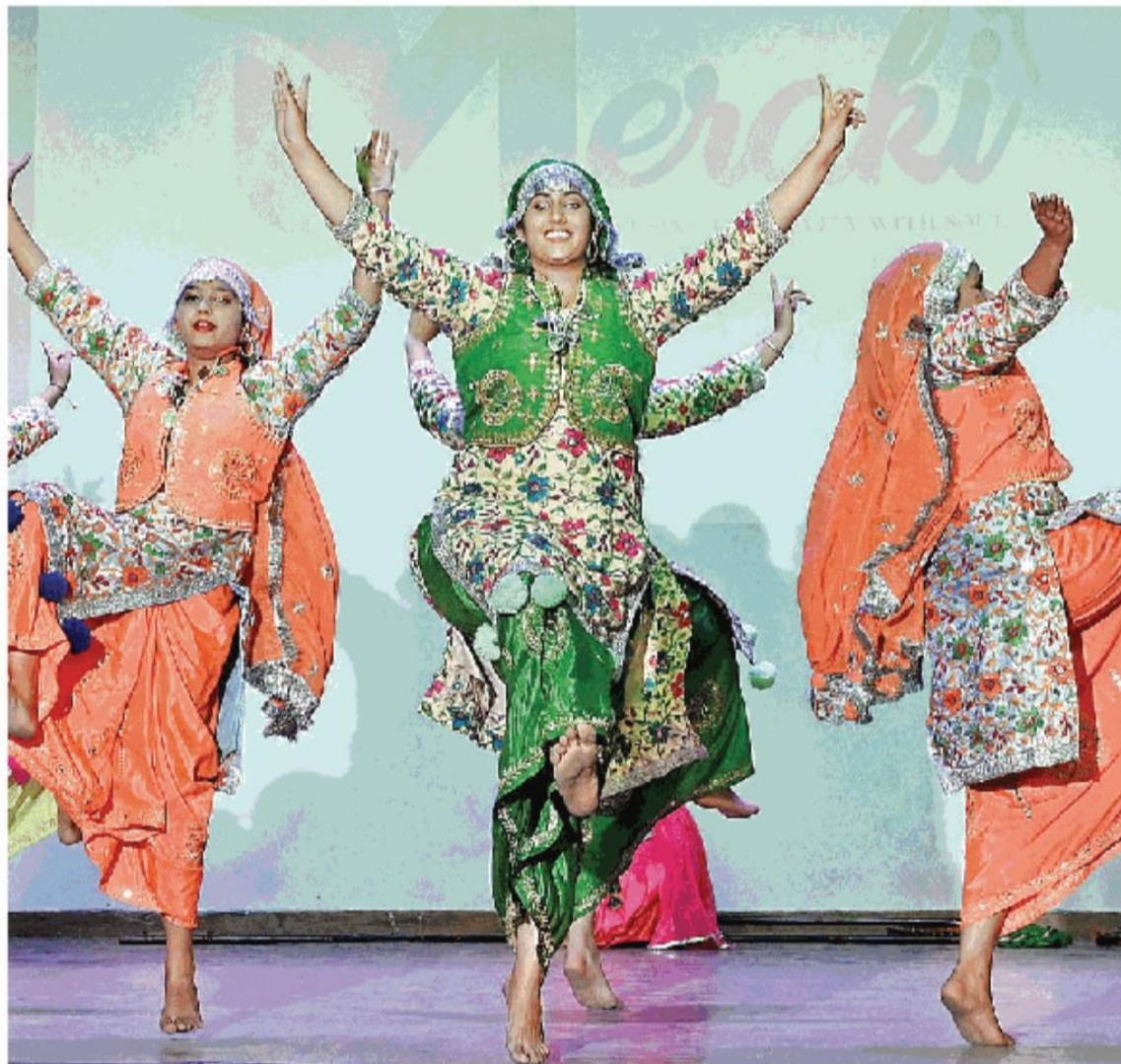
ਸੈਕਟਰ-36 ਸਥਿਤ ਐੱਮਸੀਐੱਮ ਡੀਏਵੀ ਕਾਲਜ ਫਾਰ ਵੂਮੈਨ 'ਚ ਸੱਭਿਆਚਾਰਕ ਉਤਸਵ ਮੇਰਾਕੀ 'ਚ ਗਿੱਧੇ ਦੀ ਪੇਸ਼ਕਾਰੀ ਦਿੰਦੀਆਂ ਹੋਈਆਂ ਵਿਦਿਆਰਥਣਾਂ। ਪੰਜਾਬੀ ਜਾਗਰਣ

Keeping up the tempo of day one, a plethora of events kept the competitive spirit of participants ticking and the audience mesmerized on day two as well. The day's events kicked off with an interactive session Zariya during which 6 new-age entrepreneurs shared their inspiring stories of struggle and success enlightening the audience about self-education. Adding a touch of glamour to the event, Miss Meraki saw confident beauties walking down the ramp with aplomb and grace competing for the coveted title. The audience swayed to the melodious song performances by bands of different colleges at the event- Battle of Bands, with the sounds of guitars and drums soaking the entire atmosphere in melody. The other events of the day included nukkad natak and Ad Mad.