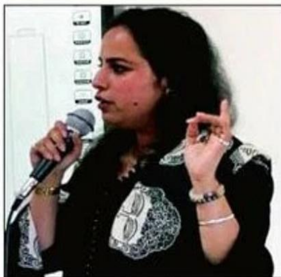
कार्यशाला में बोलती वक्ता। संवाद

सेक्टर-36 स्थित मेहर चंद महाजन डीएवी महिला कॉलेज में कार्यशाला का आयोजन