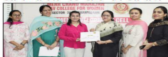
चंडीगढ़ एस्टेट समाचार विज्ञ

मेहर चंद महाजन डीएवी महिला महाविद्यालय, सेक्टर 36-ए, चंडीगढ़ के महिला विकास सेल और चरित्र निर्माण समिति ने सशक्तिकरण की अभिव्यक्ति विषय पर एक इंटरैक्टिव सत्र का आयोजन किया। इस कार्यक्रम का संचालन महिला विकास प्रकोष्ठ में बीबीए तृतीय वर्ष के स्टूडेंट एक्सप्रैस द्वारा किया गया। जिसमें विभिन्न धाराओं के लगभग 70 विद्यार्थियों ने भाग लिया। कार्यक्रम ने जीवन में कल्पित लक्ष्यों को आंतरिक विश्वास और वैचारिक शक्ति द्वारा वास्तविकता में बदलने की कला का प्रदर्शन किया। इसके लिए आकर्षण