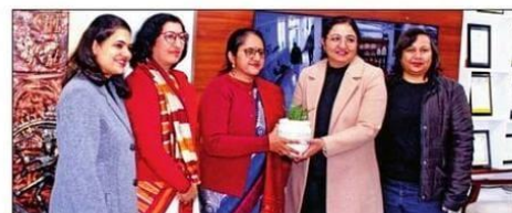
एमसीएम कॉलेज में सेमिनार के दौरान मंजूद सलाहकार।