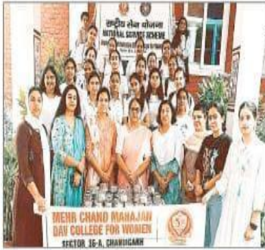
एनएसएस सप्ताह में हिस्सा लेते वालीटियर्स।

चंडीगढ़, 19 सितंबर : भारत सरकार के महिला एवं बाल विकास मंत्रालय के कार्यक्रम पोषण माह के तत्वावधान में एमसीएम डीएवी कॉलेज फॉर वुमन सैक्टर 36 की एनएसएस इकाई ने कॉलेज की कला स्वच्छता समिति के सहयोग से स्वामी दयानंद सरस्वती जी की दिशावादी जयंती के उपलक्ष्य में 7 दिवसीय कार्यक्रम के अंतर्गत गवर्नमेंट हाई स्कूल, सैक्टर 41- डी, बधेरी, चंडीगढ़ में संपूर्ण स्वास्थ्य सप्ताह मनाया गया। पहले दिन विद्यार्थियों को परमनल हाइजीन के