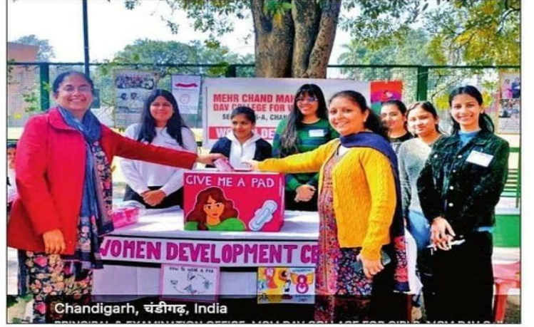
डीएवी महिला महाविद्यालय में महिलाओं को सैनेटरी पैड बांटती छात्राएं।