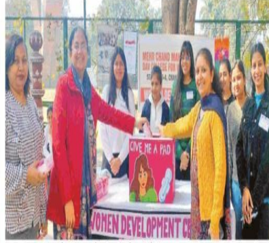
एम.सी.एम. के वूमैन डेवलपमेंट सेल ने सैनेटरी नैपकिन दान अभियान का आयोजन किया।

कॉलेज समुदाय की उत्साही भागीदारी के कारण संग्रह अभियान पूर्ण रूप से सफल हुआ। संग्रह अभियान के पूरे होने पर सेल ने सैक्टर-25 के स्लम क्षेत्र में रहने वाली महिलाओं को सैनेटरी नैपकिन दान किए।