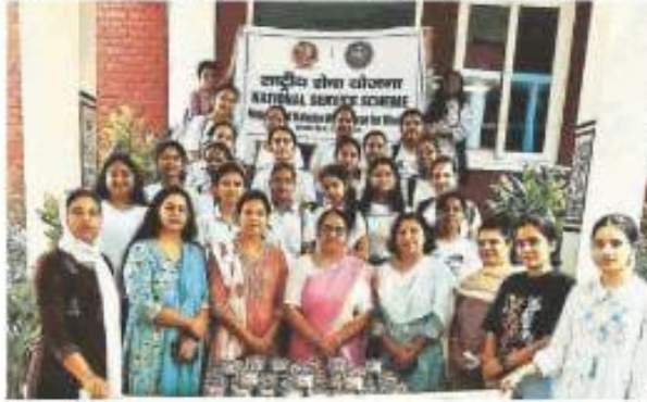
कॉलेज परिसर में आयोजित कार्यक्रम में भाग लेती हुई छात्राएं।