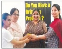
लिए सहयोग व्यवस्था शामिल होनी चाहिए। अल्कोहॉलिकस एनार्मिस्टस के सदस्यों ने अल्कोहॉलिकस से उबने और सामाजिक जीवन में वापसी के प्रसंग अनुभव सांकेतिक रूप से कहा कि यह उनका अपनाने है कि समाज के विभिन्न मैदान पर इस प्रकार को सामाजिक चेता और जागरूकता फैलाई जा। कार्यक्रम के अंत में कार्यवाहक प्रचारियों ने शर्मा ने गैरवांछित कार्टेजिंग हेल्थलाइन को इस दिना में निर्दिष्ट प्रयासों को सहजता को और कहा कि मानसिक स्वास्थ्य सहजता सहज एवं स्वाभाविक को सहज बनने के लिए इस तथ्य के स्विटनेसला कार्यक्रमों का नियमित आयोजन सहजनीय है।

चंडीगढ़, 21 मई (राम सिंह बहाड़): चंडीगढ़ स्थित मेहर चंद महाजन स्पोर्ट्स महिला मानविकीय कौशल गीताजी काउंसिलिंग हेल्पलाइन एवं हेल्पर केंद्रों ने एनटीओ अल्कोहॉलिस्म एनॉन्सिस (एए) के सहयोग से 'अल्कोहॉल हटो' इय अवचेतन प्रोग्राम' विषय पर कार्यशाला का आयोजन किया। यह कार्यशाला मानसिक स्वास्थ्य पहल 'स्वच्छ मन अभियान' के अंतर्गत आयोजित की गई। इस कार्यशाला में अल्कोहॉलिस्म से बर्तन, चंडीगढ़ के सीरिसि पेयमेंट, संजोको कौशल बतौर मुख्य वक्ता शामिल हुए। उनके साथ अल्कोहॉलिस्म