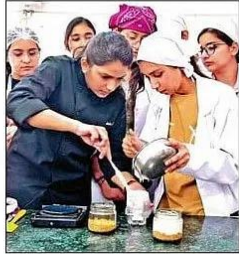
कार्यशाला में भाग लेती छात्राएं।